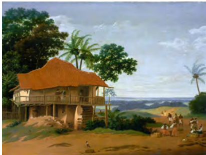
Braziliaans landschap – Frans Post

De Casas de Taipa , tradinionele (eco-vriendelijke) leemstuc huisjes, zijn in grote delen van Pernambuco inmiddels verdwenen. Ook op het eiland Itamaracá (het eiland van Fort Oranje en de Trilha dos Holandeses, waarop in het Nassau-jaar 2004 onze Secretaris, toen Voorzitter, tot Ereburgeres verkozen werd). De verandering van bouw materiaal van de woningen is uiteraard goed voor de gezondheid van de bevolking, want ook een gevaarlijk insect woont graag in zo'n lemen huisje met lekker veel kieren en spleten. Deze Barbeiro (= kapper), zoals de tropische roofwants Triatoma triatominae in Brazilië in de volksmond heet, brengt de gevaarlijke Ziekte van Chagas over. Een uiteindelijk dodelijke ziekte, waartegen nog steeds geen afdoende medicijn beschikbaar is.