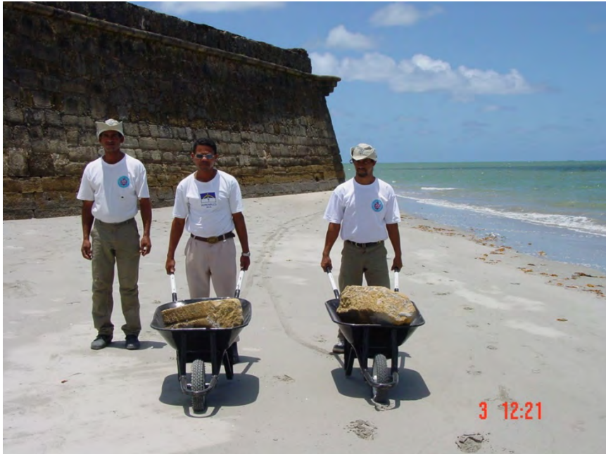
De Stichting MoWIC stelt zich ten doel het cultureel erfgoed van de voormalige Geotrooierde West-Indische Compagnie te onderzoeken en te beschermen. Hier geassisteerd door drie operários van het Project Fort Oranje, 2002-2003