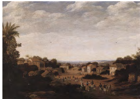
Frans Post, ISS Cosme e Damião, garassú, 1669 IRB Recife

MoWIC is in gesprek met de Prefeitura van Itamaracá, om dit project op te zetten. Het zal ingepast moeten worden in het masterplan voor Itamaracá dat IPHAN in 2012 lanceerde voor Fort Oranje en omliggend gebied. MoWIC heeft voor de constructie van de huisjes €15.000 ter beschikking. Een mooie besteding van het door Beschermheer Temminck Groll aan MoWIC toegekende PBF prijzengeld in 2008.