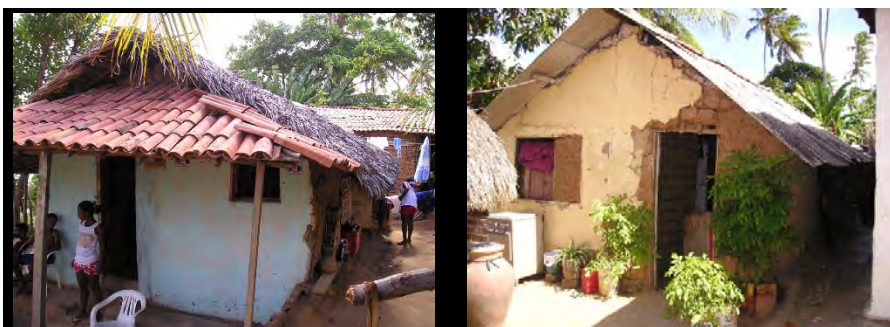
Twee archetypes van lemen woningen op A Ilha de Itamaracá, 2005.